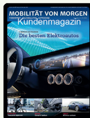
Full Page Ad verlinkt direkt auf das Magazin