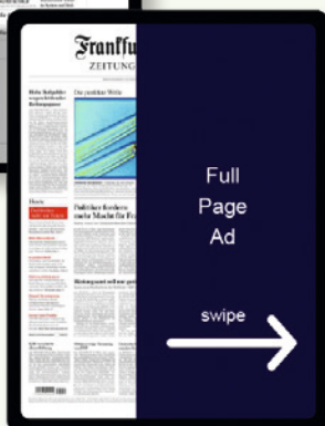
Trafficzufuhr über über eine Ad in der digitalen Ausgabe von SZ und FAZ