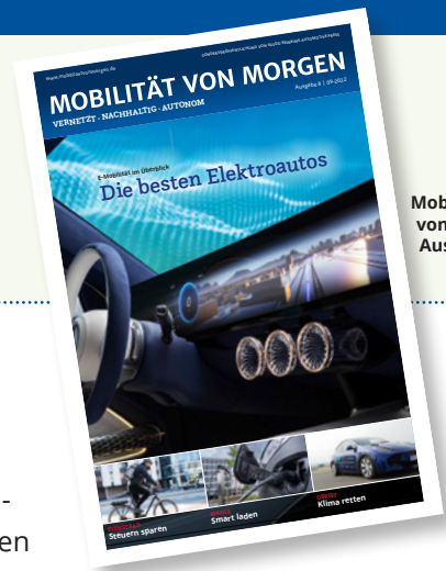
Mobilität von Morgen, Ausgabe 2022

Wir werden elektrisch. Das ist kein Trauma, sondern eine Chance.“ Ola Källenius , CEO Mercedes-Benz