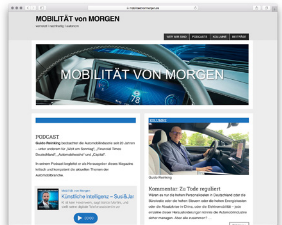
Screenshot der Website www.mobilitaetvonmorgen.de

Weitere redaktionelle Berichterstattung und Interviews runden den Inhalt des Digital- und Online-Magazins „Mobilität von Morgen“ ab.